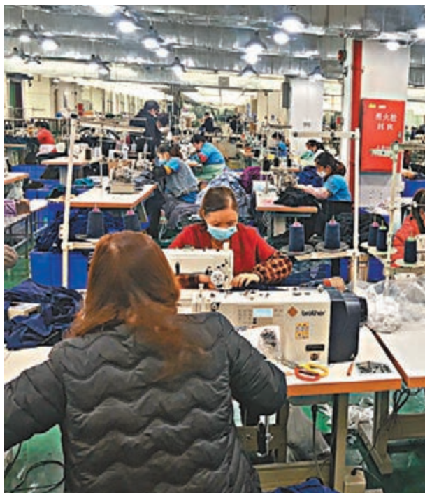
●圖為雲工廠內，每一個工人、每一台機器操作信息都以數據形式上傳平台，實時掌握生產情況。

另外，廣州市政府近日出《廣州市推進製造業數字化轉型若干政策》，結合廣州實際，針對不同規模、不同行業類型的企業實行分類推進、精準施策，提出全市製造業數字化轉型實施路徑。該措施提到，到2025年，將廣州基本建成具有國際影響力的「定製之都」和全球數產融合標杆城市。