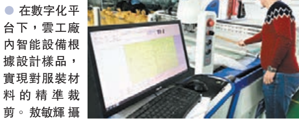
●在數字化平台下，雲工廠內智能設備根據設計樣品，實現對服裝材料的精準裁剪。