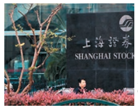
●滬指昨日收報3,622點，跌0.07%。

內地首個元宇宙產品「希壤」正式開放定向內測，率先實現10萬人同屏互動，元宇宙概念強者恒強繼續大漲，消費電子、虛擬數字人、智能穿戴等板塊漲幅居前。地產股經歷過前一交易的一日遊行情，昨高開低