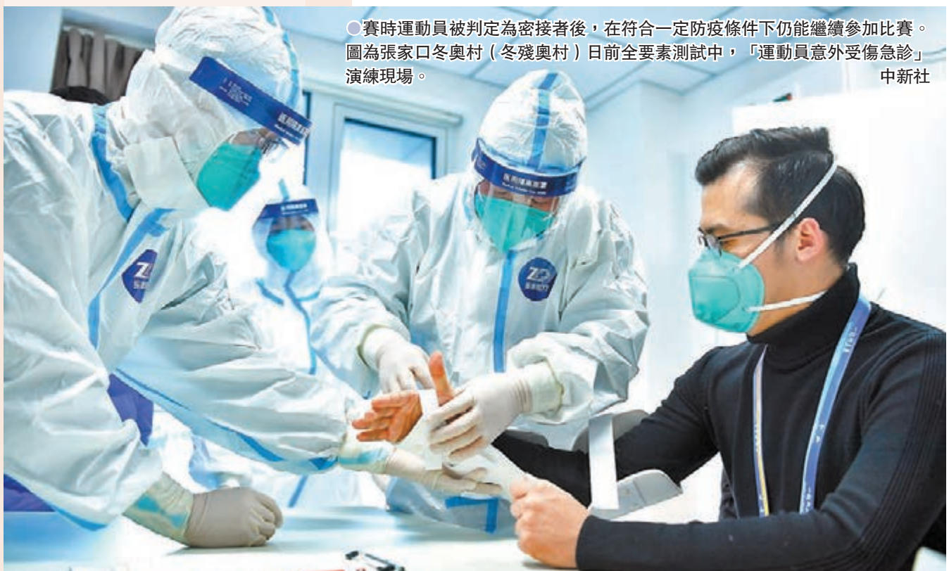
●賽時運動員被判定為密接者後，在符合一定防疫條件下仍能繼續參加比賽。圖為張家口冬奧村(冬殘奧村)日前全要素測試中，「運動員意外受傷急診」演練現場。中新社