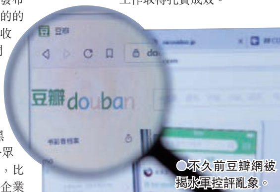
●不久前豆瓣網被揭水軍控評亂象。

網信辦要求，打擊流量造假、黑公關、網絡水軍亂象，是2021年「清朗」系列專項行動的收官之戰，要強化組織領導，推動專項整治工作取得扎實成效。