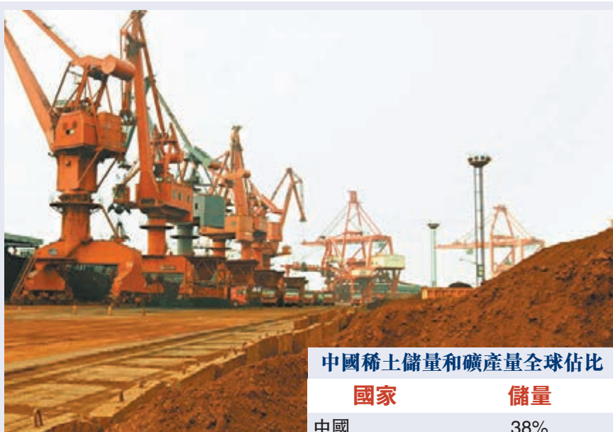
中國稀土儲量和礦產量全球佔比