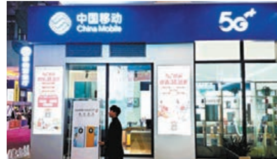
●中移動昨公布A股IPO戰略配售結果。

「中國稀土集團成立，一方面將推動中國稀土產業走向集約發展道路，另外一方面將加強中國在世界