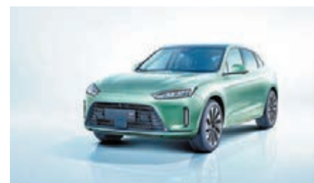
●華為昨於新品發布會上推出首款鴻蒙汽車。

P50 寶盒旗艦摺疊屏手機、HUAWEI WATCH D腕部心電血壓記錄儀、華為智能眼鏡等HarmonyOS新品，持續構建萬物智聯的全場景生態。華為常務董事、消費者業務CEO、智能汽車解決方案BU CEO余承東透露，「華為P50寶盒」依託鴻蒙HarmonyOS打造摺疊手機全新交互體驗，華為已經完成Mate、P系列摺疊旗艦雙線布局，成為了目前業界唯一一個推出外摺疊、內向摺疊、縱向摺疊三種摺疊形態手機的品牌。