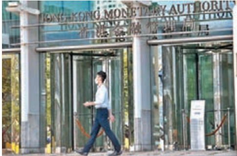
● 金管局數據反映銀行體系資產質素有改善。

貸款質素、流動性狀況及資本充足水平方面，季報顯示，銀行體系的特定分類貸款比率由上一季的0.86%進一步下降至第三季末的