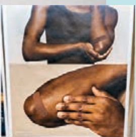
● 「Love Has No Labels」為不同膚色人士設計的膠布。