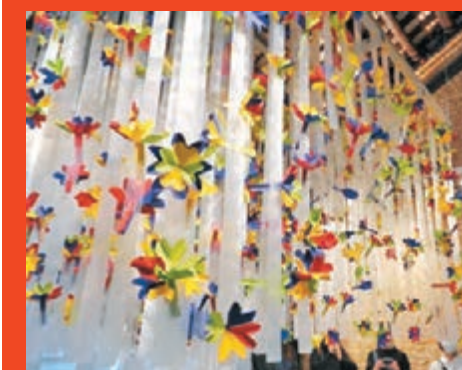
● STICKYLINE 創作的大型藝術裝置「山野漫瀾」。