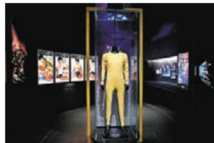
● 李小龍於電影《死亡遊戲》中穿著的經典黃色戰衣。