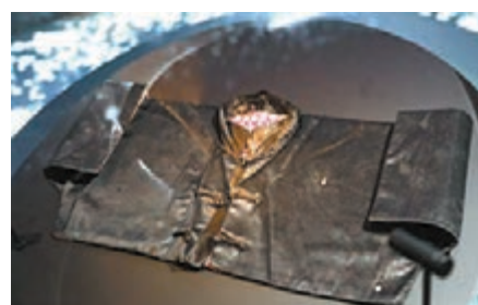
● 李小龍的嬰兒上衣。