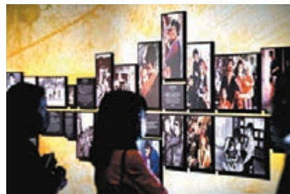
● 展覽吸引不少人士到場參觀。