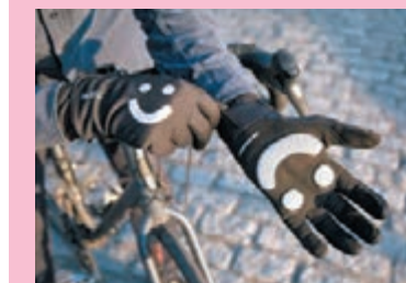
● LOFFI.單車手套令車手與道路使用者之間積極互動。 主辦方提供