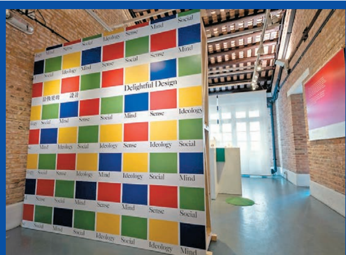
● 展覽的主視覺設計是香港資深設計師蔡楚堅 (Sandy) 運用紅黃藍綠色構建的系統。