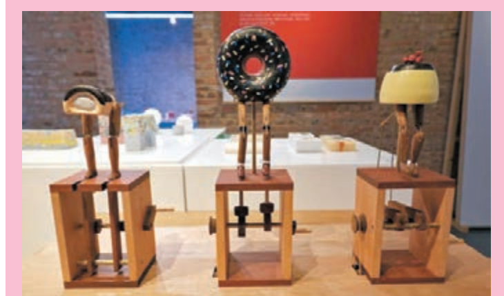
● 甜品插畫產品，為人們帶來「生活中一點甜」。