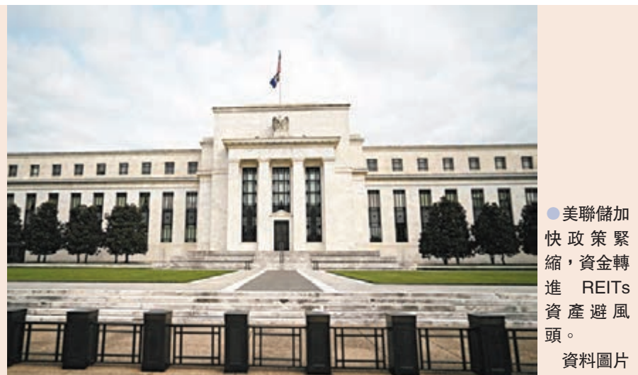
●美聯儲加快政策緊縮，資金轉進REITs資產避風頭。

根據美聯儲最新利率決策，明年1月起，縮減購債規模將調高一倍到300億美元，預計明年3月結束購債；同時，多數官員預期明年後兩年各升息3次、2024年升息2次，顯示政策緊縮速度加快。