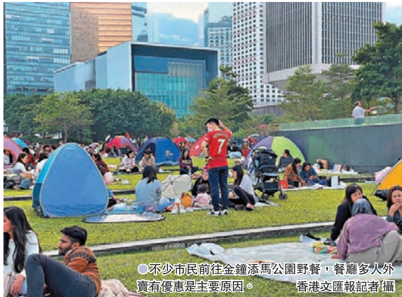
●不少市民前往金鐘添馬公園野餐，餐廳多外賣有優惠是主要原因。

香港文匯報訊(記者文森)聖誕節，不少人與三五知己外出「打卡」聚餐。有「黃媒」報道稱有「大量市民」不滿食肆「安心出行」安排，拒絕堂食而改買外賣前往公園、天橋野餐。香港文匯報記者昨日到多個受市民歡迎的公園、草地，發現野餐的市民非但沒有不滿「安心出行」，反而大多支持特區政府的防疫安排，惟假期餐廳多人，加上外賣有優惠，才選擇與朋友在公園野餐聚會。 網煽「反安心野餐團」實際冇影 日前，網上有入聲稱不滿「安心出