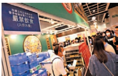
●譚太打算消費2,000元月購買食品。