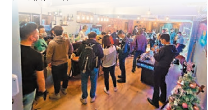
●警方平安夜加強執法打擊「犯聚」。

香港文匯報訊(記者 蕭景源)警方在前晚平安夜於全港打擊違規食肆、酒吧、派對，打擊非法活動及防止病毒在社區傳播的風險，逾300人因涉嫌「犯聚」被票控及被捕，其中大部分人被揭沒有掃碼「安心出行」及沒有佩戴口罩。警方呼籲市民為己為人，嚴格遵守相關法例，做好防疫措施，並應盡量減少社交活動及避免到人多聚集的地方。 警方於平安夜出動大批人員，通宵在東九龍、沙田、荃灣、葵青、旺角、深水埗及灣仔執法。其中，沙田警區人員突擊搜查多間派對房間，發現成運路25號至27號一派對房間涉嫌違規營業，1名31歲男負責人被票控，房間內共有6男8女(21歲至27歲)沒有使用「安心出行」，其中一名男子未有接種疫苗，全被發出定額罰款通知書。山尾街37號至41號另一派對房間亦因未於處所外張貼表列處運作模式告示，其34歲男負責人被警方票控。 旺角警區突擊搜查區內多間餐飲處所，共有19男17女顧客(30歲至60歲)因沒有使用「安心出行」或違反「限聚令」被票控，另有兩間處所內16名男顧客(21歲至57歲)，因沒有佩戴口罩被票控。 荃灣及葵青警區則拘捕11間派對房5名負責人(20歲至36歲)，票控場所內43男30女顧客(17歲至58歲)。一間酒吧則涉嫌違反「限聚令」被發出傳票。 東九龍總區在將軍澳、觀塘及黃大仙拘破5間無牌酒吧，4間涉嫌違規營業的派對房間及1間懷疑釣魚機賭場，拘捕8男3女負責人(23歲至47歲)，以及152名顧客(15歲至58歲)，全部人均涉嫌違反「限聚令」同被票控。行動中，警方檢獲342餐酒、1,144罐啤酒、4部電視、兩部飛鏢機、4部卡拉OK機、3部釣魚機、兩部射擊遊戲機及少量危險藥物。 昨日清晨5時許，深水埗警區人員到大南街195號至201號興基大廈地庫一間酒吧巡查，發現酒吧內約有240名客人，當中5男5女(36歲至59歲)沒有使用「安心出行」應用程式被票控，酒吧43歲男負責人未有確保顧客使用「安心出行」被警方拘捕。 灣仔警方亦於昨日凌晨突擊搜查登龍街一帶食肆，兩間餐飲店內有5名顧客因沒有使用「安心出行」流動應用程式被票控，被罰停止堂食14天。