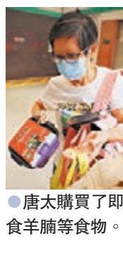
●唐太購買了即食羊腩等食物。