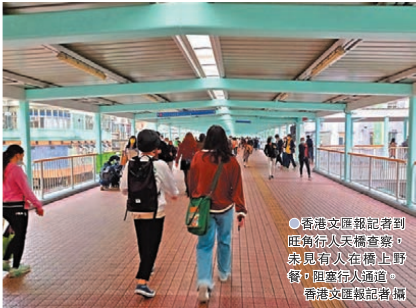
●香港文匯報記者到旺角行人天橋查察，未見有人在橋上野餐，阻礙行人通道。