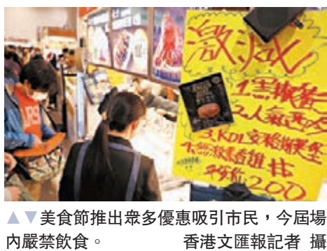
▲美食節推出眾多優惠吸引市民，今屆場內嚴禁飲食。