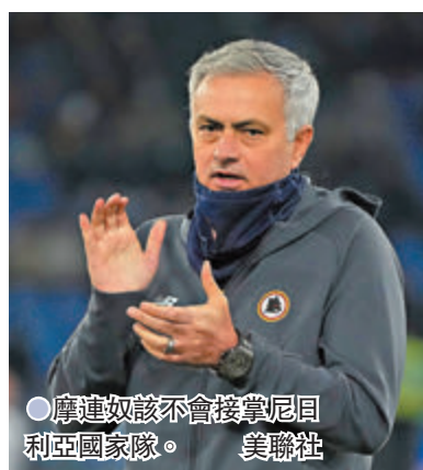
●摩連奴該不會接掌尼 日利亞國家隊。

接觸是不可能的，就連尼日利亞 體育部長也已經和他交談過了。」 然而，摩連奴其實在今年夏天 才和意甲羅馬簽約3年，雖然該 會目前成績平平，但摩連奴一直 表示希望長期留隊，帶領羅馬取 得進步，故尼日利亞成功邀人的 機會並不太大。