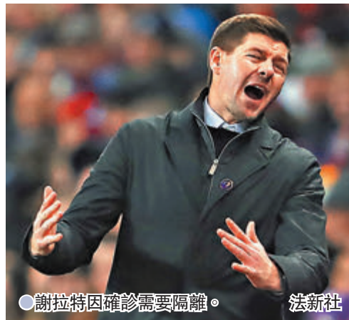
●謝拉特因確診需要隔離。

由於英國疫情持續，曼城領隊 哥迪奧拿亦作出呼籲，希望球迷 要戴口罩：「我真的不想再踢閉 門比賽，我希望球迷們能入場； 但同一時間我很驚訝他們出外時 真的完全不戴口罩，這可是防止 感染的最佳方法之一，希望大家 能再次嚴謹起來，這樣足球比賽 才能繼續上演。」