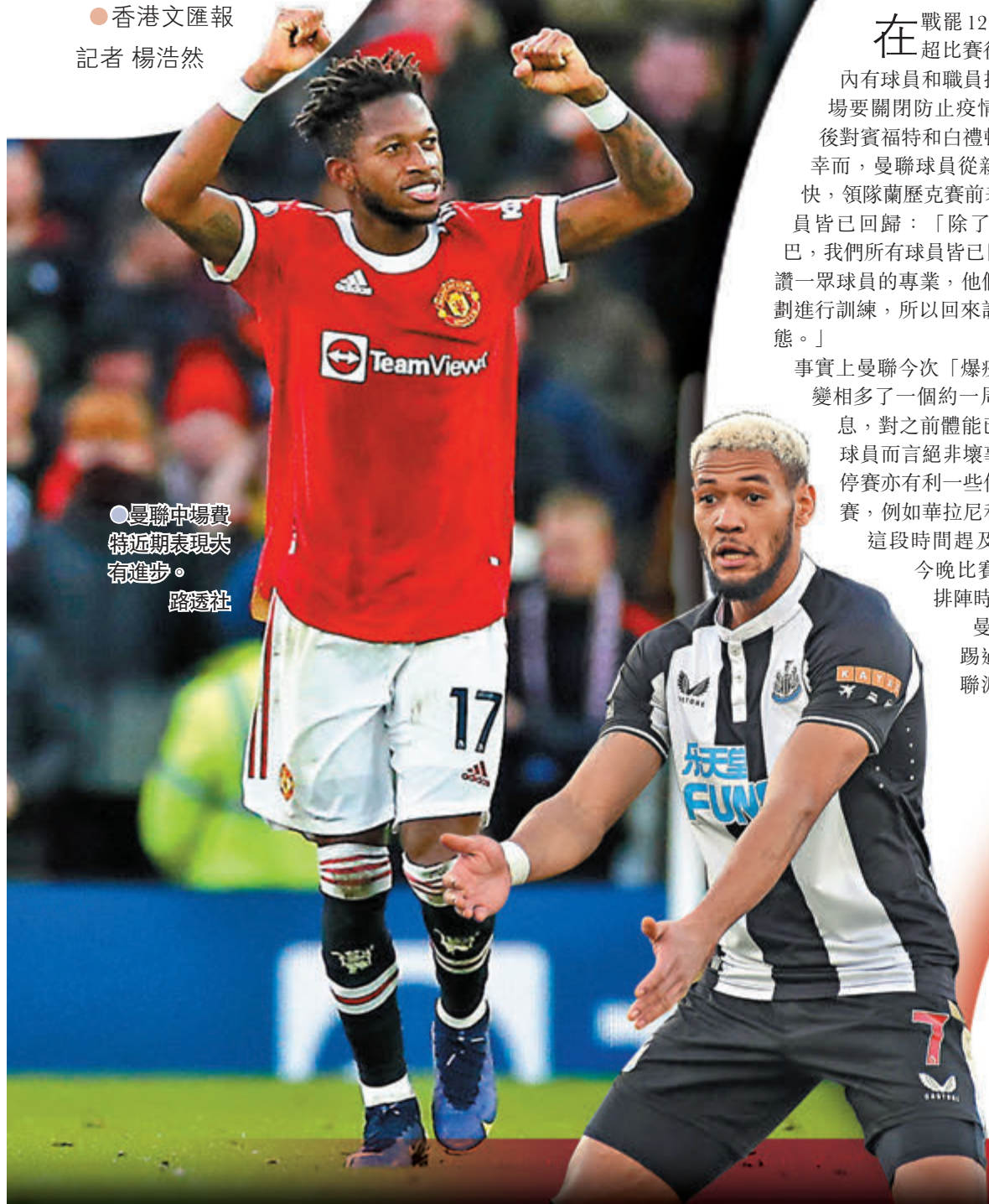
●曼聯中場費 特近期表現大 有進步。

在戰罷12月12日對諾域治英 超比賽後，曼聯突然爆出隊 內有球員和職員接連確診，更令訓練 場要關閉防止疫情惡化，結果球隊之 後對賓福特和白禮頓的聯賽皆要取消。 幸而，曼聯球員從新冠中康復的時間頗 快，領隊蘭歷克賽前表示，差不多所有球 員皆已回歸：「除了仍在養傷的保羅普 巴，我們所有球員皆已回歸操練，在此要稱 讚一眾球員的專業，他們在家中依然有按計 劃進行訓練，所以回來訓練場時皆有一定狀 態。」