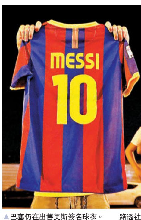
▲巴塞仍在出售美斯簽名球衣。