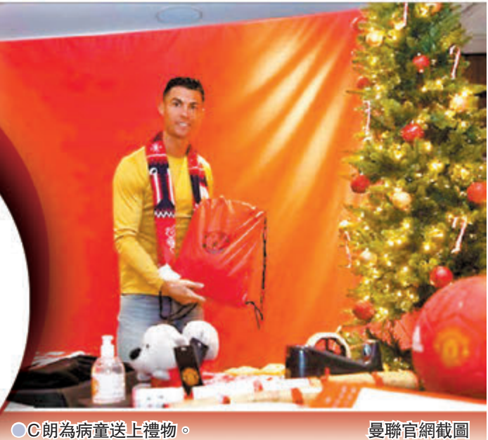
●C朗為病童送上禮物。