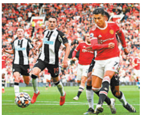
●在9月的首循環比賽，曼聯在C朗(右)梅 開二度下輕取紐卡素。

士的年青人，而兩場聯賽則以1:0小勝水 晶宮和諾域治；有曼聯球迷可能認為，曼聯 在蘭歷克帶領下好像還是未能踢出預期的高 位逼搶踢法，對諾域治比賽更好像前領隊摩 連奴和蘇斯克查年代一樣，在形勢上處於下 風；然而要注意曼聯兩場勝仗皆是在沒有失 球下取得，證明於蘭帥領導下，曼聯最起碼