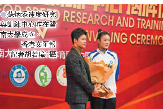
蘇炳添速度研究與訓練中心昨在暨南大學成立。

香港文匯報訊（記者 胡若璋、李薇 廣州報道）蘇炳添速度研究與訓練中心27日落戶暨南大學。該中心由中國田徑協會指導，廣東省體育局和暨南大學共建。由競技表現分析與訓練中心、速度能力與機能評定實驗室、