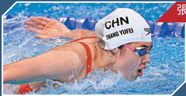
張雨霏：不畏失敗破繭成蝶

征服世界需要多久？只在水一剎那間。伴隨着消失的水花，全紅嬋成為寵兒中的寵兒。五輪動作，三個滿分。初出茅廬的全紅嬋用無懈可擊的表演征服了所有人，包括她一眾同為奧運冠軍的師姐，贏得東京奧運10米台金牌。站上高台後的沉着與堅定，反而可能令周圍人忘卻，全紅嬋，其實還只是14歲的小姑娘。但她用金牌證明，儘管年齡尚小，但自己已挑得起這份重擔，和與之對應的榮譽。大器不必晚成。全紅嬋從十米高台縱身一躍，看似平靜的水面下，是她洶湧澎湃的光明未來。