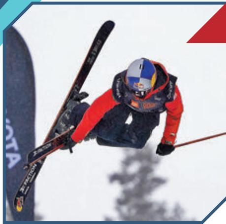
谷愛凌：勇敢嘗試不留遺憾

當幾乎所有美好的詞匯都適用於一人身上，「天才」也會變成有些平庸的形容詞。谷愛凌就是這樣一個「別人的孩子」。她是即將入讀世界名校的高材生，更承載着國人對於冬奧榮譽的嚮往。短短兩年，谷愛凌已在各項世界比賽中將十餘枚金牌攬入懷中。中國冰雪運動的紀錄被她刷新了一個又一個，中國冰雪運動的歷史由她書寫了一章又一章。加速、翻轉、青春飛揚，谷愛凌展現着冰雪運動的魅力；勤奮、自信、勇往直前，谷愛凌展現着當代青年的形象。青年時光轉瞬即逝。她告訴自己，要勇敢嘗試，不留遺憾。