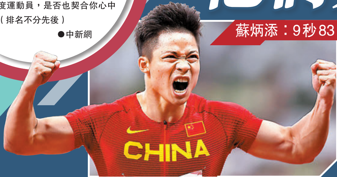
蘇炳添：9秒83 實現夢想

蘇炳添，9秒83，黃種人登上奧運百米決賽舞台。用「創造歷史」形容那一夜，都顯得過於單薄，勾勒不出那聲嘶力竭後的壯闊。3年前，當蘇炳添在亞運會中折桂，他說自己還能跑得更快，黃種人可以打開9秒90大關。如今32歲的他，十破十秒、十全十美。百米賽道似乎很短，短到用9秒83就可以丈量；百米賽道又彷彿很長，長到跨越百年才等來這一天。蘇炳添說，這是最美好的回憶，他實現了夢想。