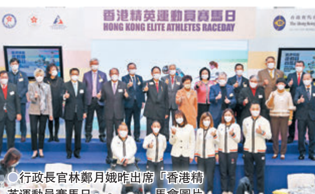
行政長官林鄭月娥昨出席「香港精英運動員賽馬日」。

馬會主席陳南祿及體院主席林大輝也讚揚香港運動員有出色表現，以香港彈丸之地能有此佳績，相信社會各界以至全港市民都感到十分光榮和自豪。難得走入馬場，東京奧運會單車爭先賽銅牌得主李慧詩，亦特別下注$20買何澤堯策騎的「獵狐章者」，惜最後