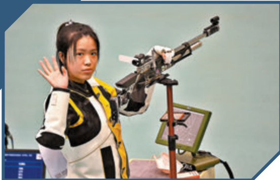
鞏立姣：逐夢的路沒有捷徑

奧運首秀，兩金加身。從她槍口射出的子彈，征服了億萬國人的心。與賽場上的冷峻和堅毅不同，髮卡、美甲、洋娃娃，賽場外的楊倩因周身一切看似平凡的小物件而反覆被提起。21歲的楊倩，集萬千寵愛於一身。她是奧運冠軍，是清華學子，也是自稱「楊大妞」的鄰家女孩。無論賽場內外，無論哪種狀態，她都是焦點。