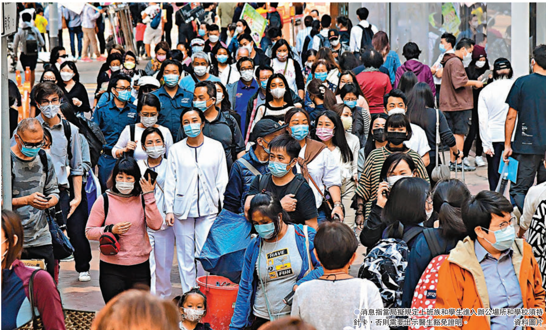
●消息指當局擬規定上班族和學生進入辦公場所和學校須持針卡，否則需要出示醫生豁免證明。資料圖片

消息指，香港特區政府研究擴大「疫苗氣泡」範圍至所有辦公場所和學校，日後若落實措施，返工返學也需要打針，只有經醫生證明不適合接種者獲豁免。