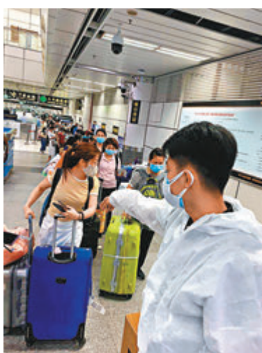
●深圳口岸邊檢人手不多，既要嚴謹檢查入境港人的核酸檢測結果，又要再安排採樣檢測，令過關時間大大延長。資料圖片

全國人大常委、民建聯會務顧問譚耀宗，以及全國政協委員、民建聯主席李慧琼，昨日聯署致函深圳市政府口岸辦公室，指年關將至，大批港人急著過關，經深圳灣口岸