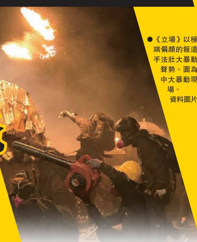
●《立場》以極端偏頗的報道手法壯大暴動聲勢。圖為中大暴動現場。