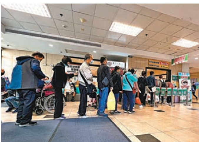
●由於暫停探病，病人物品僅可由院方職員代送。昨日中午，市民在聯合醫院排隊送物資給住院家人。

香港新冠肺炎第五波迫近，李季健提醒市民保持警覺，以及積極接種新冠疫苗，減低染疫後出現重症風險，變相也能避免拖垮香港醫療系統，「新冠疫情後，市民對於呼吸道疾病預防的意識明顯提高，雖疫情平穩許久，但市民在新年切勿放鬆警惕，萬一Omicron社區爆發，外加流感高峰，香港公立醫療服務系統負荷量將十分巨大。」