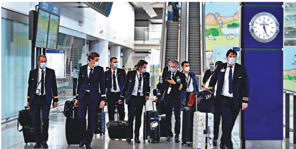
●特區政府昨日起收緊機組人員檢疫安排，抵港首三天必須居住檢疫酒店。圖為昔日機組人員來港。資料圖片