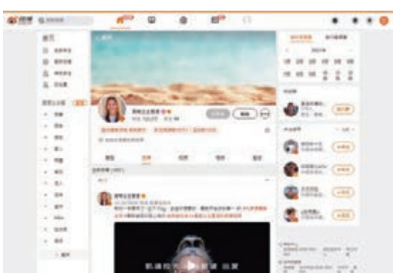
● 滑雪美少女谷愛凌經常更新自己的微博。

此外，微博與中國冰雪大會達成戰略合作，共同致力於在冰雪運動領域展開全面合作，宣傳中國冰雪國家隊和運動員，推廣大眾冰雪運動，助力中國冰雪運動發展。