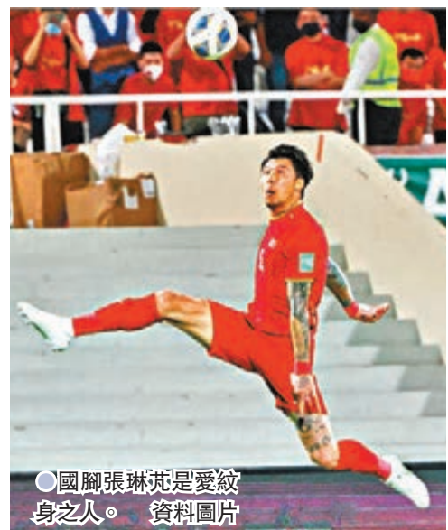
● 國腳張琳芃是愛紋身之人。