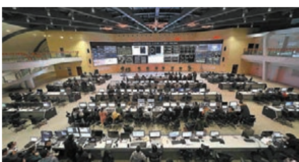
◆中國「人造太陽」EAST裝置控制大廳。