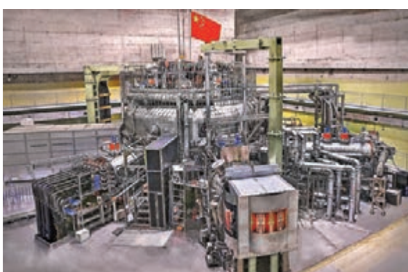
◆素有「人造太陽」之稱的EAST全超導托卡馬克裝置（東方超環）（資料圖）。

據介紹，EAST裝置運行15年來，先後實現了1兆安、1.6億度、1,056秒的等離子體運行，通過開放共享的建制化管理模式，全面實現了EAST設計參數指標，在穩態等離子體運行的工程和物理上繼續保持國際引領。