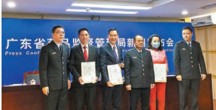
◆三家港澳企業獲頒首批港澳傳統外用中成藥內地上市註冊證書。