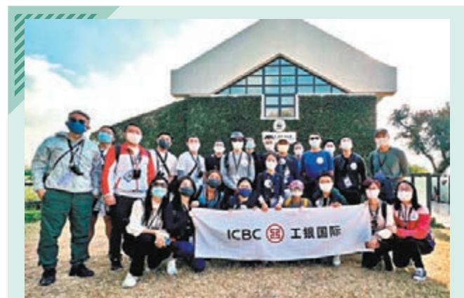
工銀國際踐行公益

當前，滬深港通信息分散在不同的平台，同時，如指數調樣公告日期等訊息不能完全預測，且港交所受颶風等影響會有臨時的交易安排等情況。為幫助身處世界各地的投資者第一時間掌握三方市場關鍵信息，洞悉市場變化，中華交易服務此次特別推出該「滬深港通交易日曆」小程序，取代傳統的紙質版日曆，為三方市場參與者提供實用工具和官方信息平台，幫助用戶及時獲取可靠的市場信息。