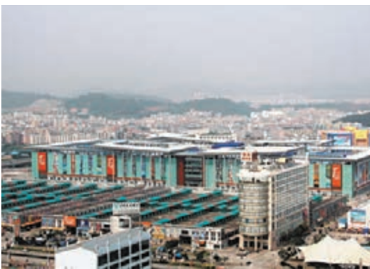
◆ 特區建發集團將成為華南城主要股東兼單一最大股東。資料圖片

另一方面，公司將探索與特區建發集團的合作機會，以實現業務協同效應，盡力提高股東回報，同時支持實體經濟的可持續發展。特區建發集團與華南城同日訂立戰略合作協議，雙方在戰略合作中共享投融資源、項目資源、產業資源、城市規劃專業能力、園區運營經驗。