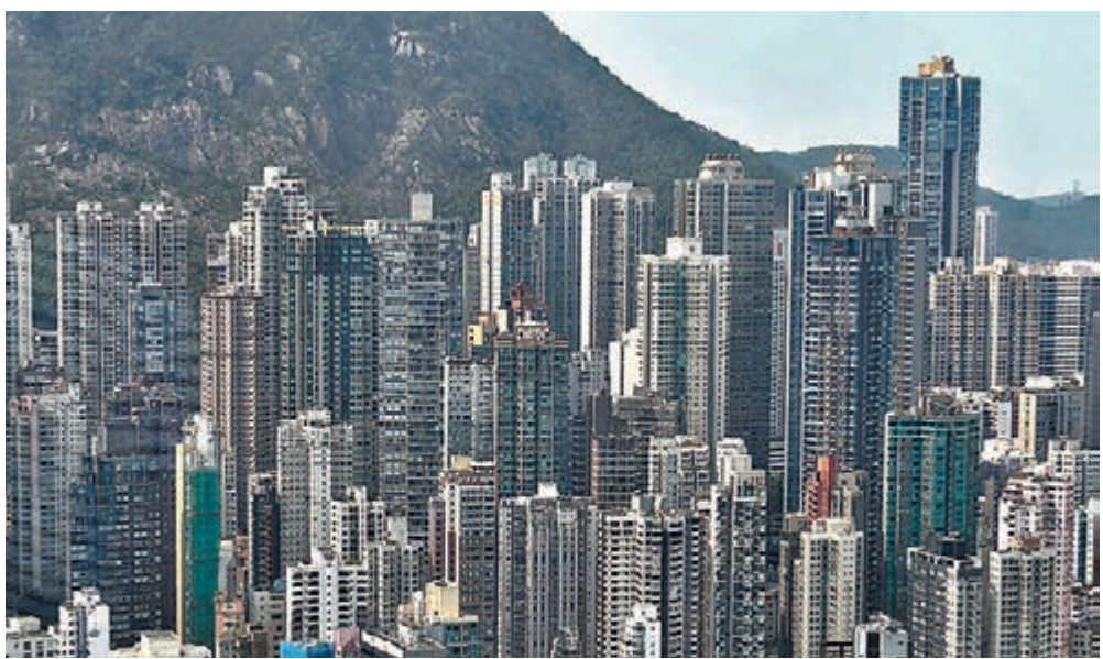
◆ 本港樓市去年整體物業註冊量見9年新高。

2021年已經完結，回顧過去一年樓市，在疫情下交投仍然相當活躍。據美聯物業房地產數據及研究中心綜合土地註冊處資料顯示，2021年(截至12月30日)整體物業(包括一手私樓、二手住宅、一手公營房屋、工商舖、純車位及其他等)註冊量合共錄95,833宗，比起2020年73,322宗高出約30.7%，創9年新高。