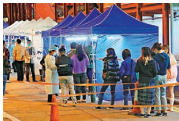
◆昨晚同時圍封北角英皇道 275 號南天大廈，作強制二期強檢。