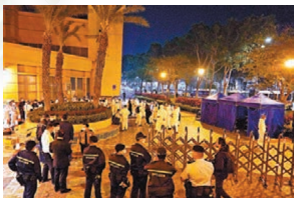
◆一名國泰機組人員初確，政府昨晚圍封東涌映灣園第二期映灣軒第六座。