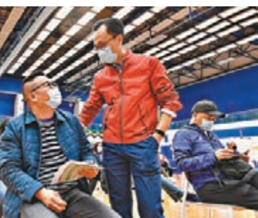
▲全港多個疫苗接種中心昨日爆滿。圖為渣華道體育館。

間社區疫苗接種中心中，有 9 間延長開放時間至每天上午 8 時至下午 8 時。公立醫院內的接種站亦已增至 13 間，流動接種站亦會由本周五 (7 日) 起增至兩個。公務員事務局局長聶德權昨日到設於荔枝角公園體育館的疫苗接種中心，視察社區疫苗接種中心在延長開放時間後首日的運作情況。他強調，疫情下不能心存僥倖，呼籲市民盡快打針。