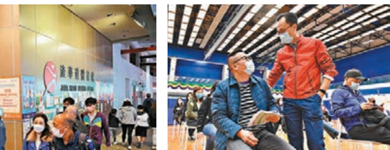
▲聶德權 (左二) 與一名剛接種第三劑新冠疫苗的市民交談。

趁假期去打針的馮先生承認，因為「疫苗氣泡」即將實施才到場接種疫苗，「除非不在社會中生活，