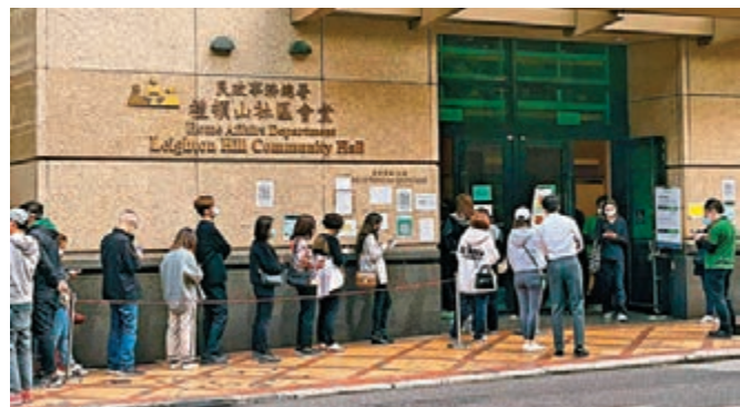
◆銅鑼灣社區會堂外大量市民排隊等候做檢測。

香港文匯報訊（記者 張強）77個指明地點昨日被納入強制檢測公告，全港30多個社區檢測中心及流動採樣站昨日人山人海。其中，油麻地梁顯利社區檢測中心大排長龍，現場一度約有200多人輪候，市民需等約兩小時才完成檢測。有排隊等候的市民表示做檢測是盡公民責任，亦有市民昨日接種新冠疫苗後不久被僱主通知必須做檢測，半天假期也用於排隊檢測及打針上。