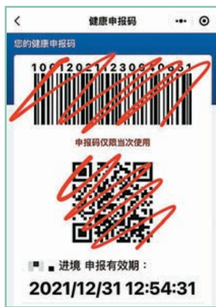
◆上海機場有工作人員核對「健康申報碼」，簽署「採樣知情同意書」。