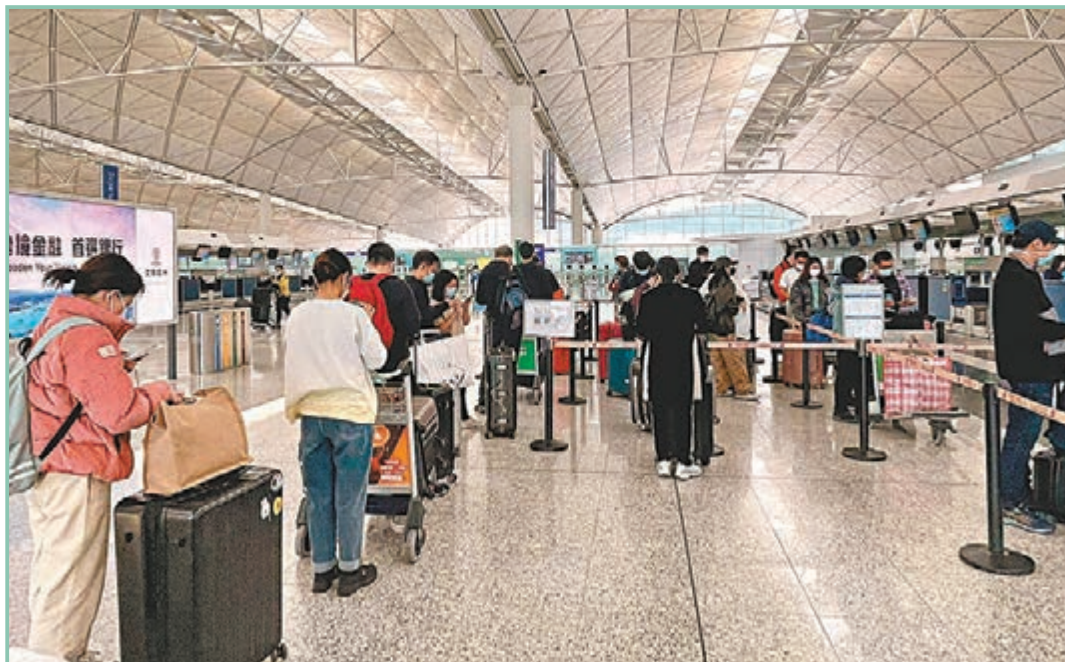
▲香港國際機場航空公司櫃檯前大排長龍。

月是故鄉明，人是故鄉親，距離中國人最重要的節日——農曆新年，尚餘約一個月時間，香港文匯報記者跟許多掛念家鄉的港人一樣，日前收拾行裝踏上回家路。從香港乘搭航班往上海期間，記者親身體驗兩地機場「外防輸入」措施的同與不同，其中上海機場防疫的一絲不苟值得香港借鏡，日前經過約兩小時飛行，航機抵達上海浦東機場，停機坪上客機逐架機卸客，其間乘客必須留在機艙上，避免多班客機的旅客交集造成交叉感染，故記者單是等落機已花逾兩小時。之後，乘客獲「多站點、多櫃檯」分流，有效避免人流聚集，其間接受體溫探測、採樣，以及多次掃描「健康申報碼」，才順利完成清關手續，流程之嚴密、機場人員保護裝備之嚴謹也令人讚嘆。