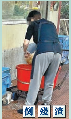
侍應執枱傳菜等「一腳踢」，且未有洗手或消毒，專家擔憂添播疫風險。