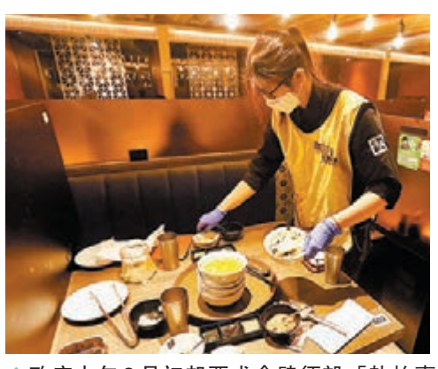
政府去年3月初起要求食肆須設「執枱專員」，否則負責有關工作人員須在每輪收拾期間按需用潔手液或換手套。

他表示，去年3月，飲食業仍處於較低迷的時期，當時只有大集團旗下的食肆才有能力增聘「執枱專員」；其後業界逐漸復甦，惟人工上升，又變得難以請人，故料目前只有300間食肆設「執枱專員」，佔全港食肆1%左右，其餘食肆均是樓面或收銀兼任。