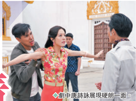
劇中唐詩詠展現硬硬一面。