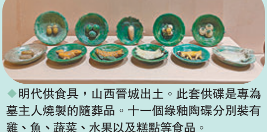
◆明代供具，山西晉城出土。此套供碟是專為墓主人燒製的隨葬品。十一個綠釉陶碟分別裝有雞、魚、蔬菜、水果以及糕點等食品。