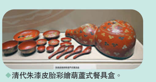
◆清代朱漆皮胎彩繪葫蘆式餐具盒。