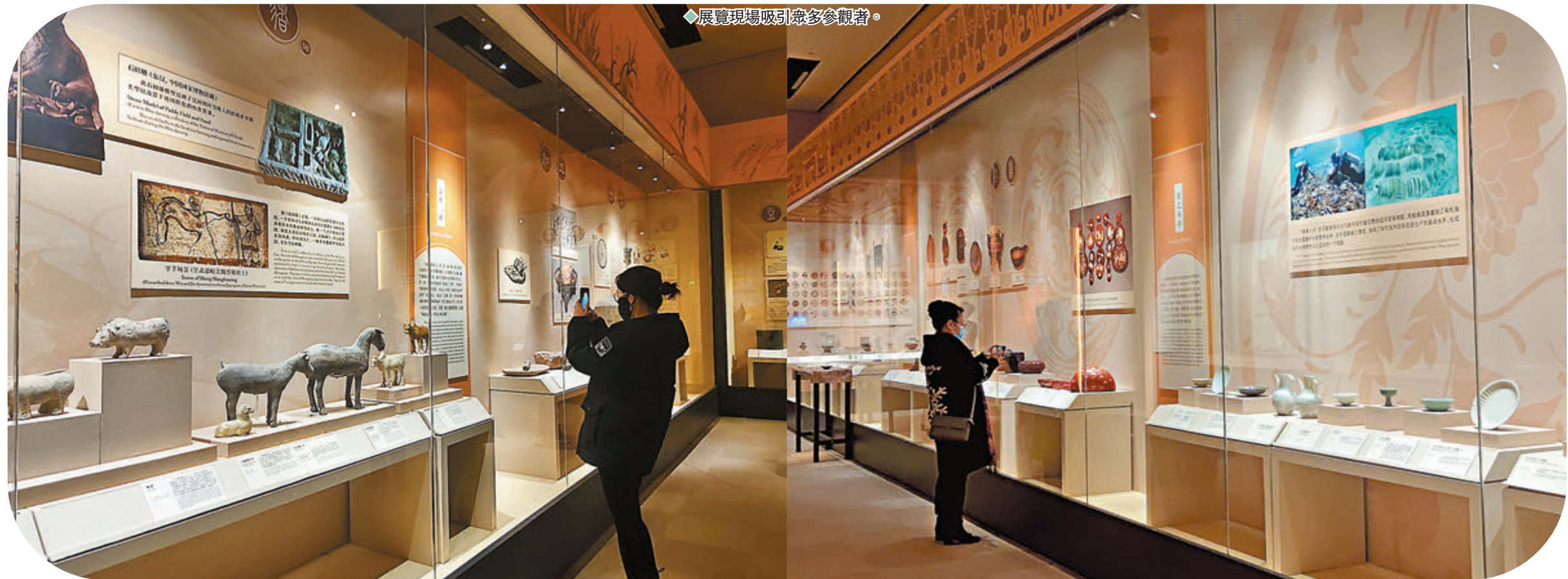
◆展覽現場吸引眾多參觀者。

新石器時代的碳化稻米、商代的酒器、漢代的銅烤爐、唐代的餃子、鴻門宴場景復原、古人席地而食體驗區……中國國家博物館日前正式推出「中國古代飲食文化展」，展出240餘件(套)精選文物，從食材、器具、技藝、禮儀等不同角度，系統闡釋中國古代飲食的發展變遷與文化內涵，引導觀眾品味中國味道。展覽還設置多個有趣的互動項目，助觀眾感知中華民族貫通古今的生活趣味，觀眾亦可足不出戶線上看展，並通過微博微信互動、觀看展覽直播，共同「尋味人間」。