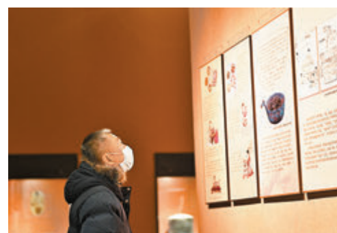
◆參觀者在遼寧省博物館參觀飲食文化展。