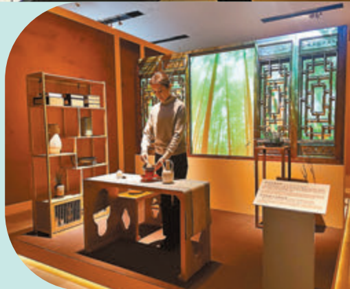
◆工作人員演示宋代點茶場景。

展覽還通過多個場景展示了飲食文化。其中，釀酒蒸餾場景向觀眾講述了古人釀製「白酒」的過程。據介紹，中國的酒可分為自然發酵的果酒、釀造的糧食酒和蒸餾酒三個階段。蒸餾酒也就是大眾習稱的「白酒」，一般認為始於元代，也有東漢說、唐代說等觀點。宋代點茶場景則向觀眾介紹了點茶這一宋代最為風行的技藝，包括炙茶、碾茶、羅茶、烘盞、候湯、擊拂、烹試等一整套程序。同時系統介紹了羹飲法(唐及前代)一煎茶法(唐代)一點茶法(宋元)一瀹飲法(明清至今)等一系列中國飲茶方式的改變。中國人自古以來就格外重視長幼尊卑，古代社會生活的各個方面都有着嚴格的禮儀規範。座次的排列是古代宴飲禮儀的重要組成部分。今次展覽特別引入鴻門宴場景復原，通過對「鴻門宴」座次的描寫，反映出中國古代有以東為尊的傳統。同時，這一場景復原還向讀者講述了「鴻門宴」的地點應在軍帳。在古代，除了軍帳或一般普通的房子外，若在堂上舉辦宴會，一般以南向為尊。