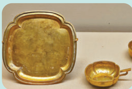
◆元代海棠式金盤和金杯。