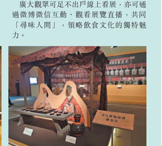
◆古人席地而食體驗區。

廣大觀眾可足不出戶線上看展，亦可通過微博微信互動、觀看展覽直播，共同「尋味人間」，領略飲食文化的獨特魅力。