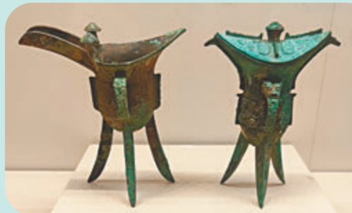
◆商代銅爵(左)和青銅角。