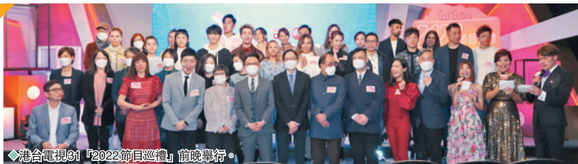
◆港台電視31「2022節目巡禮」前晚舉行。