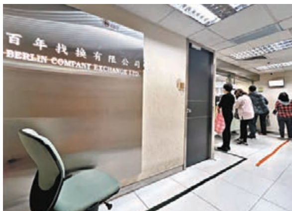
●昨日仍有大批市民惠顧「百年找換店」。

對於突如其來的結業消息，她感嘆道：「以後如果要換韓幣可能就要考慮女兒去韓國再換了，暫時也不知道