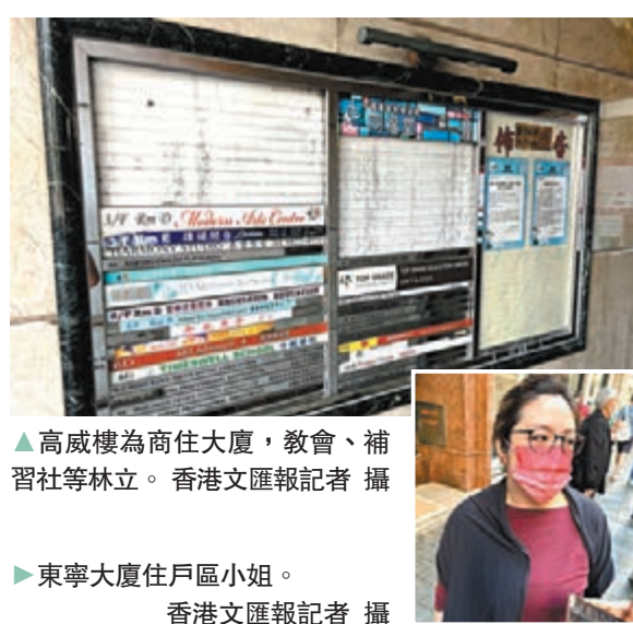
▲高威樓為商住大廈，教會、補習社等林立。香港文匯報記者 攝 ▲東寧大廈住戶區小姐。香港文匯報記者 攝

至於翠寧花園第二座，居民周女士表示，事件雖然突然，但過去兩年自己與家人十分重視清潔消毒，她希望面對新一波疫情來襲下，政府應該進一步收緊防疫措施，確保市民安全。翠寧花園業主關注組副主席陳女士居於翠寧大廈鄰座，對於該屋苑管理公司的表現滿意，認為管理處反應迅速，又及時為大廈及附近