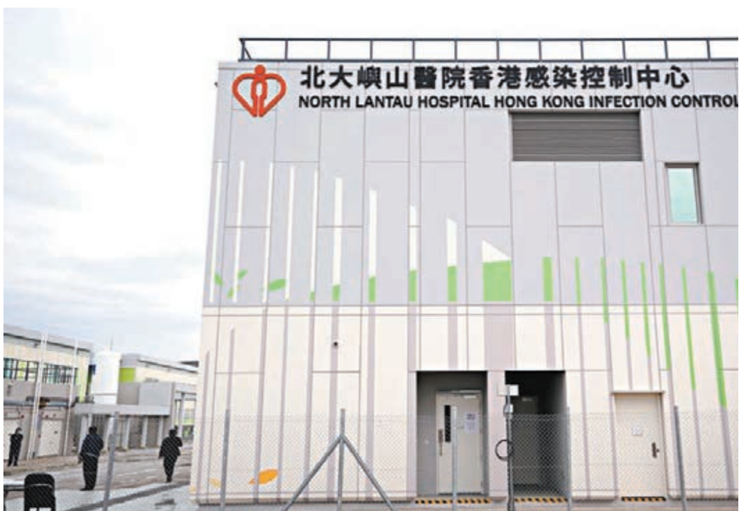
●高拔陸表示，北大嶼山感染控制中心的 800 張病床已有 340 多位確診者入住，如果每天持續新增四五十宗確診個案，相信數天後便飽和。圖為北大嶼山感染控制中心大樓。資料圖片

高拔陸說，醫管局正檢視各公立醫院的一線隔離病床供應情況，盡量騰空病床，但由於現時正值冬季流感高峰期，且多間醫院的內科病床使用率已過 100%，隔離病床供應壓力很大。林文健呼籲，曾到訪需強檢地方的市民，盡快接受檢測，同時再度呼籲市民盡快注射疫苗。