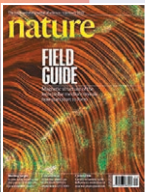
《自然》雜誌封面刊登FAST科學成果。