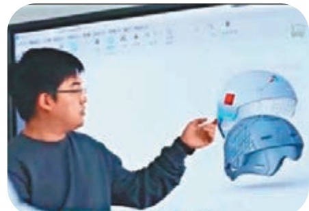
滑雪頭盔運用航天薄壁結構設計，還創新了曲線加筋變剛度的設計技術。視頻截圖

在頭盔材料方面，科研團隊在大量測試後使用碳纖維、玻璃纖維、彈性體三種成分合成的新材料，在維持衝擊韌度不變的情況下，能讓頭盔的剛度提高4倍、拉伸強度提高3倍，大幅提升了頭盔的抗衝擊吸收效率。此外，考慮到亞洲人的頭型偏圓，研究團隊還搜集了大量中國國家隊隊員的頭圍數據，開展定製化的設計，提高了中國運動員長時間佩戴的舒適度。目前已經用於保障國家雪上空中技巧專業隊的訓練。