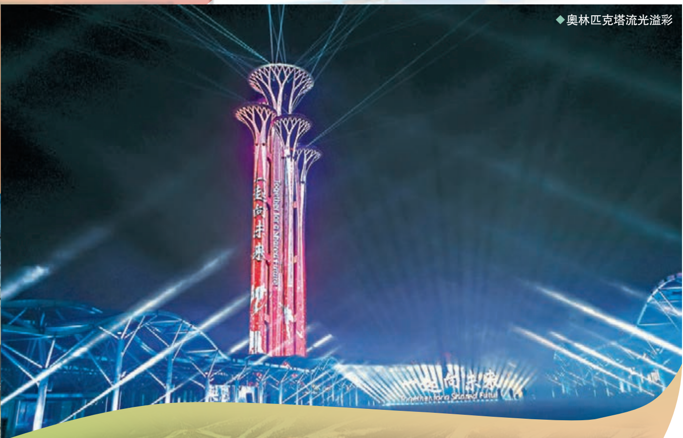
◆ 奧林匹克塔流光溢彩