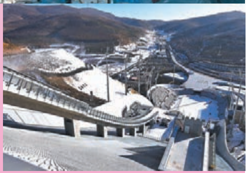
◆ 張家口賽區古楊樹場館群

而在崇禮冬奧核心區的古楊樹場館群中，一柄「如意」雄踞雪原，在這個國家跳台滑雪中心面前的兩側山谷，國家越野滑雪中心和國家冬季兩項中心坐落其間；「冰玉環」將三者綴珠成串，在不