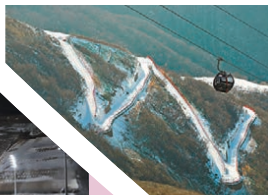
◆ 纜車在國家高山滑雪中心上空穿行

2022年冬奧會的雪上項目賽區之一，這兒還建有國家雪車雪橇中心競賽場館和延慶冬奧村、山地新聞中心兩個非競賽場館。