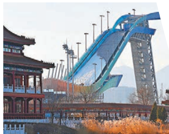
◆ 首鋼滑雪大跳台夜景