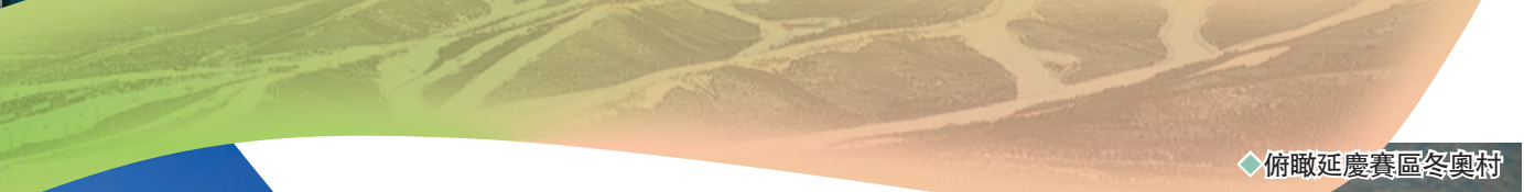
◆ 俯瞰延慶賽區冬奧村