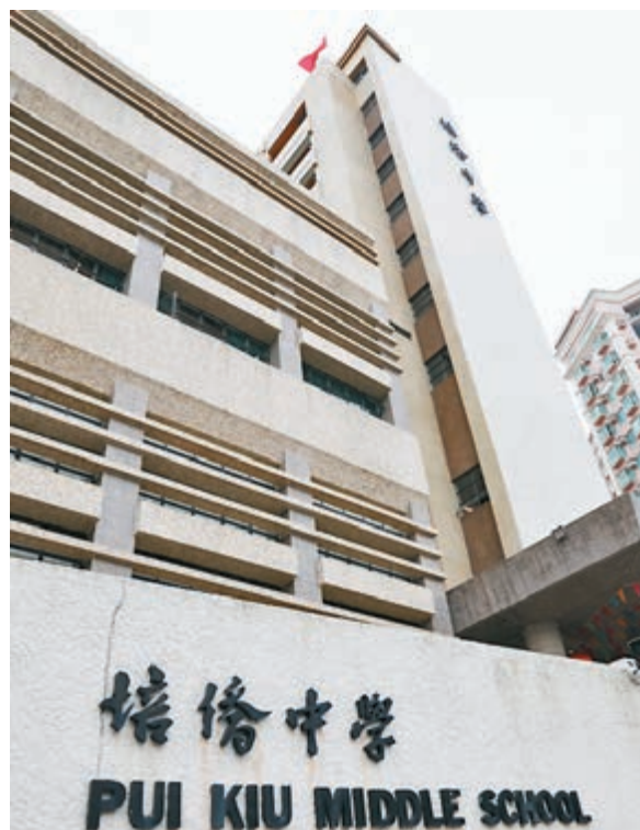
◆培僑中學前日因為有學生的家長染疫，即日起停課3天消毒。資料圖片

香港文匯報訊（記者 文森）香港中小學還有兩週便放春節假期，目前正值期中考試，詎料香港爆發多組國泰機組人員引發的感染群組，第五波疫情迫在眉睫，其中東區直資中學培僑中學前日（5日）因為有學生的家長染疫，即日起停課3天消毒，全校師生需往檢測中心進行檢測，但學界擔心全港停課影響學生的學習進度，所以對停課有所保留。