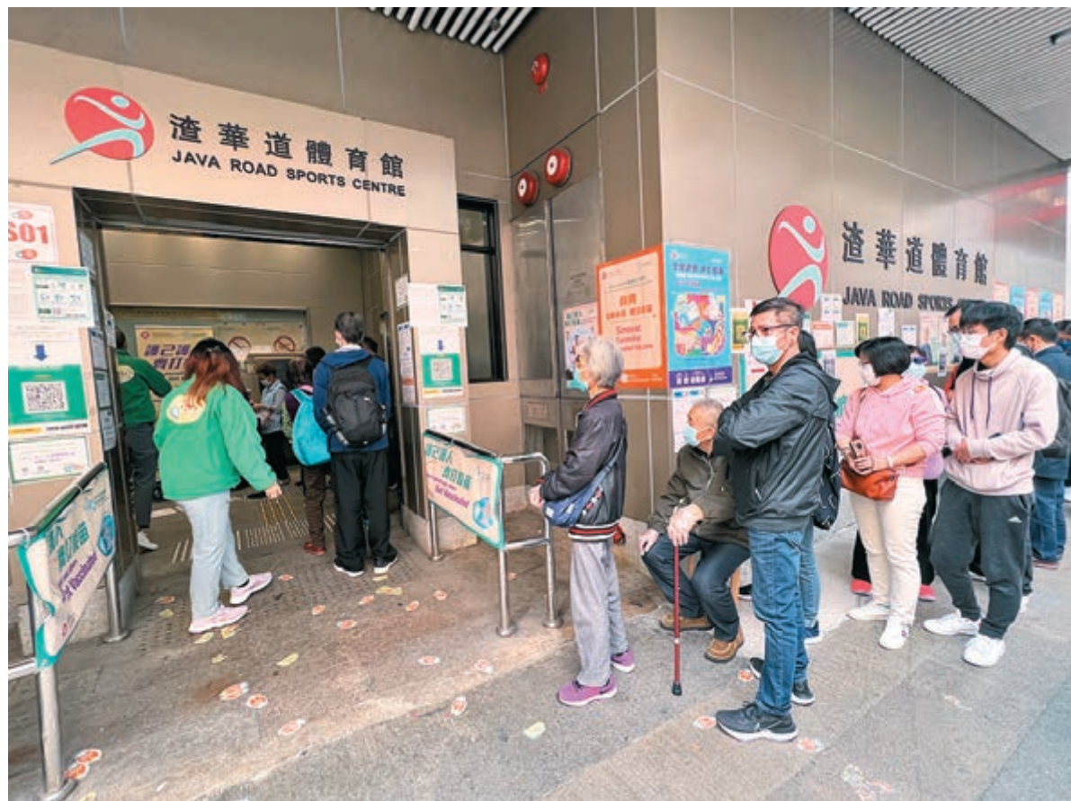
◆位於北角的一間社區疫苗接種中心外昨日大排長龍。

他重申，接種疫苗不只是防感染，而是防重症，未接種疫苗的感染後死亡率，會較已接種疫苗高10倍至