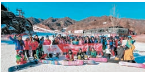
◆京港青年滑雪場合照

高興。滑雪過後，同學們還獲得了冬奧會的紀念品：特製的本、筆、書籤，還有年味盎然的紀念徽章。內地青年同港青「全副武裝」，在雪場集體合影，共話情誼，又是何等的意氣風發！晚上的活動則是在京港生的跨校聯歡——一場以「港風復古」為 dressing code (穿着規範)，融合抽獎、歌舞、遊戲於一體的新年大Party。來自北京不同高校的港生共唱鄉音，共話鄉愁，聽到《風再起時》這樣的經典歌曲，四座無不齊聲以和，雖隔千里之外，依然不妨礙在這個最容易睹物思人的時期夢回香江。 這麼說來，我也確實好久沒回去了。前些日子參加立法會投票，也不過是在規則之內在口岸轉了一圈。不過，離開既有的舒適區固然會失去一些東西，卻也可以獲得很難得的成長體驗。就像滑雪一樣：如果不親自來到內地，一直呆在香港一處，可能很難體會滑雪的樂趣，也認識不到更多的人。「我住的城市從不下雪」的抱怨，固然