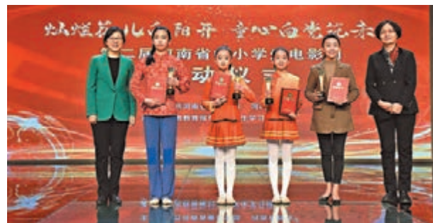
◆與會領導為優秀微電影作品進行頒獎。