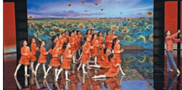
◆舞蹈劇《永遠的紅燈》