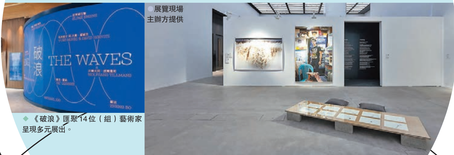
展覽現場