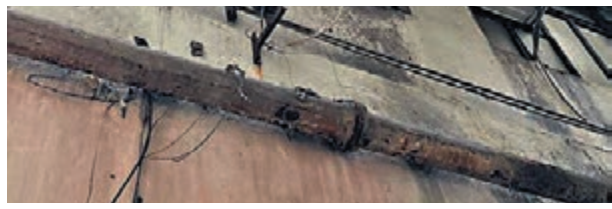
◆美蘭閣大廈外渠管出現生鏽及破損情況。