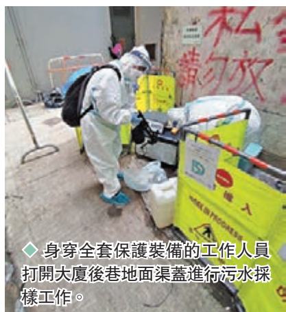
◆身穿全套保護裝備的工作人員打開大廈後巷地面渠蓋進行污水採樣工作。

其餘 3 幢大廈同樣未有人確診，利順大廈有兩人未進行強制檢測，已獲強制檢測令。仁禮花園及毓成大廈則未發現有人未進行強制檢測。