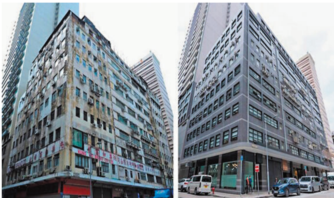
◆近60年樓齡的長沙灣永康工廠大廈在2013年市建局啟動項目時，呈老化失修（左），經過維修及由市建局改造後，現已是一幢具多元化用途的現代化樓宇（右）。

更重要的是共同探討為有意活化改造工廈的業主提供更多誘因，政府亦可重新審視各項針對工廈改造用途和地契條款的要求，提供彈性或寬免措施。韋志成說：「希望可從多方面鼓勵業主透過重建或復修及改造重設，活化工廈，善用土地資源。」