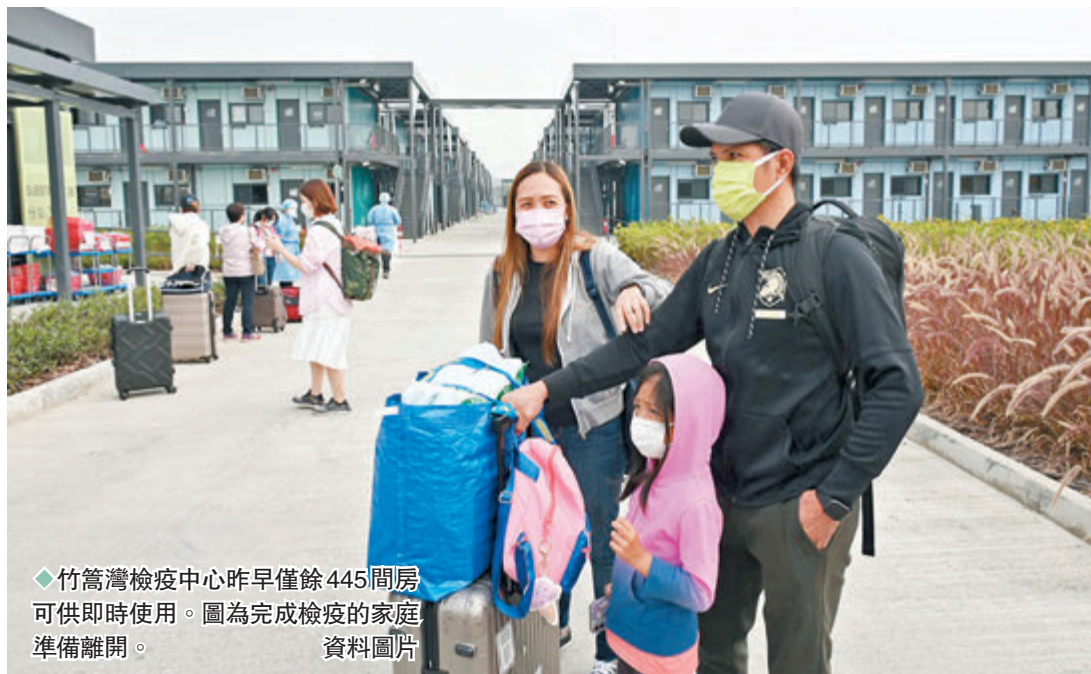
◆竹篙灣檢疫中心昨早僅餘 445 間房可供即時使用。圖為完成檢疫的家庭準備離開。

感染及傳染病學學會副會長林緯遜昨日表示，14 天至 21 天才發病的 Omicron 個案雖然較少，但居家自我監察人士須留意身體狀況，避免參與不必要的社交活動，出入時應有所記錄，若有不適可向政府交代行蹤。