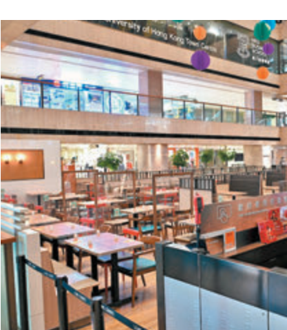
◆張宇人估計，措施使大部分業界只剩兩成生意額。圖為下午 6 時後一食肆暫停堂食。

香港文匯報訊（記者 張弦）特區政府因應新冠肺炎疫情走向，早前對食肆業界收緊社交距離措施，行政會議成員、飲食界立法會議員張宇人估計，措施使大部分業界只剩兩成生意額，全行損失 50 多億元，建議特區政府按食肆牌照大小，提供不同額度的資助，以及加大「百分百擔保特惠貸款」額度。