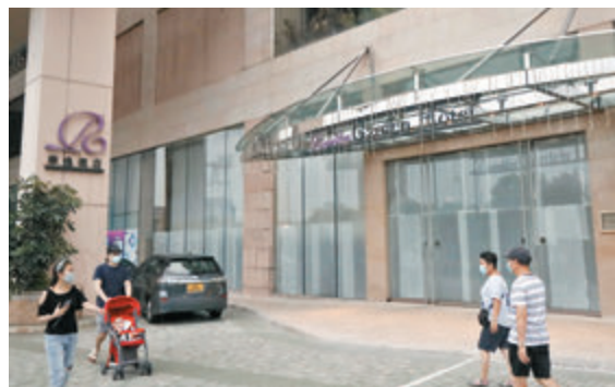
◆青衣華逸酒店外傭檢疫房間數目將增至 650 間，房費將漲至 700 元一晚。

香港文匯報訊（記者 文森）疫下外傭市場人手緊絀，抵港外傭檢疫設施供不應求，勞工處昨日宣布下月 1 日起，青衣華逸酒店將額外加推 150 個房間，作外傭檢疫用途，令該酒店的外傭檢疫房間數目增至 650 間，但房費亦將上漲至 700 元一晚。今日（11 日）上午 10 時起，外傭及僱主