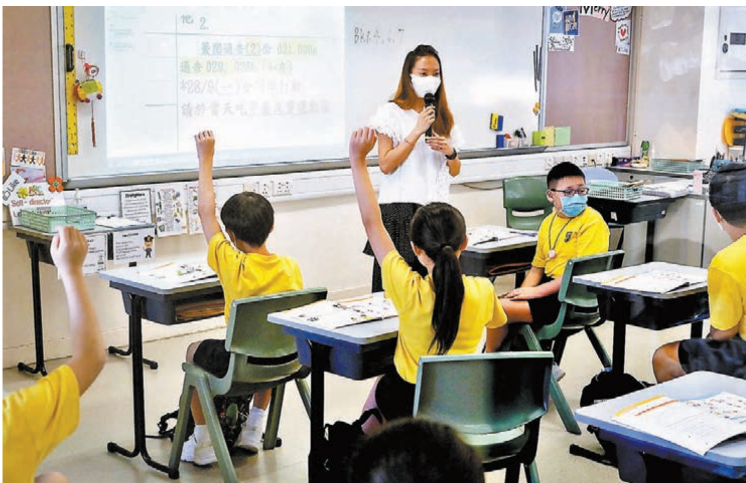
◆全港幼稚園及小學在本星期五或之前暫停面授課程。圖為疫下小學生上課。

香港醫院藥劑師學會會長崔俊明昨日在電台節目上也表示，未接種疫苗的兒童屬高危群組，若兒童接種後，能減少一旦感染後將病毒傳染給長者的機會。他續指，復必泰藥廠已進行臨床試驗，用三分之一的成人劑量已達到安全性、有效性和免疫反應，香港可參考英國的做法，「（兩針