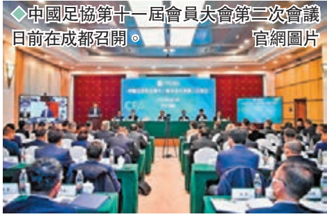
◆中國足協第十一屆會員大會第二次會議日前在成都召開。