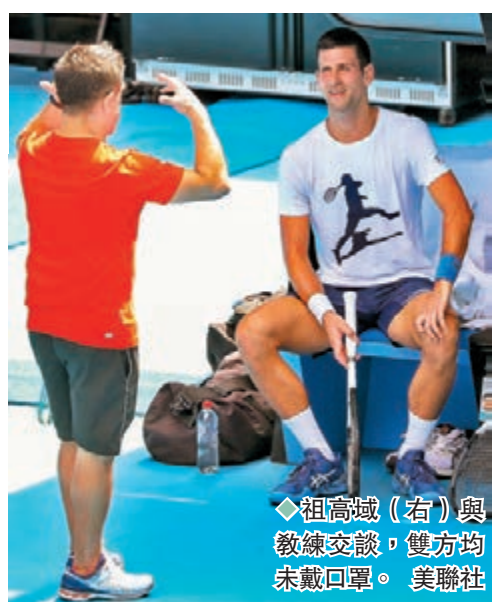
◆祖高域(右)與教練交談，雙方均未戴回罩。

網壇「一哥」、塞爾維亞球星祖高域當地時間10日在贏得他的澳洲簽證案法律戰後數小時，於個人社交網站twitter發布他在澳網中央球場Rod Laver Arena ahead的練習照片。他寫道：「我很高興及感謝，法官推翻我的簽證撤銷案。儘管發生了這一切，我仍希望留下，並參加澳洲網球公開賽。」