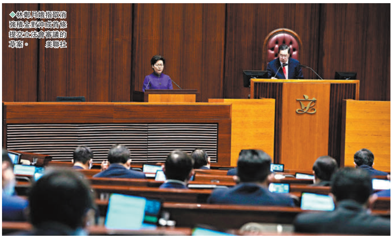
◆林鄭月娥指取消強積金對沖成為首條提交立法會審議的草案。

鄧家彪在會後見記者時表示，取消強積金對沖牽涉打工仔退休後的生活保障，在過去4季被對沖的金額便達65億元，認同問題不能再拖，歡迎特區政府以取消對沖作為第七屆立法會的首條法案，並會要求即將成立的立法會人事務委員會，在農曆新年前加開會議，以盡快完成審議工作。