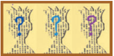
◆讀者幻想中的作者總有多少神秘感。

問T叔可有給讀者罵過？他坦率說有，讀過懂煎荷包蛋的女孩子可愛，就給一個女孩子來信罵他大男人。