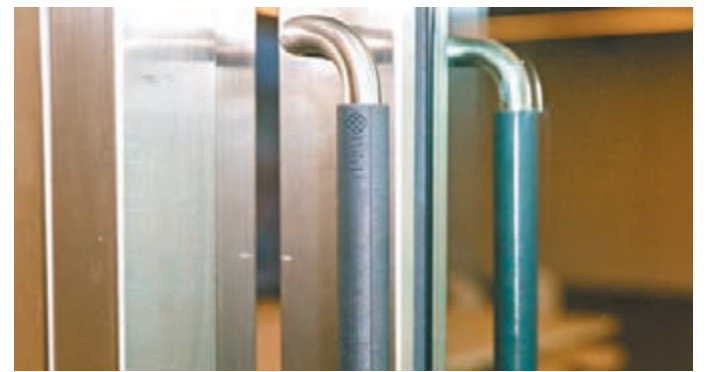
▲物料可用於製作手柄套,避免病毒和細菌殘留表面。