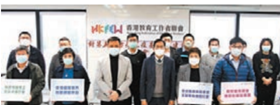
◆教聯會盼政府第五輪防疫抗疫基金支援教育界及相關行業。

鄭泳舜表示,過去很多行業包括賓館業都有堅持自力更生,亦用很多新方法吸引市民,包括爭取做過渡性房屋等,過程中亦遇到不少困難,希望特區政府在防疫抗疫基金中給予賓館業界更多支援。