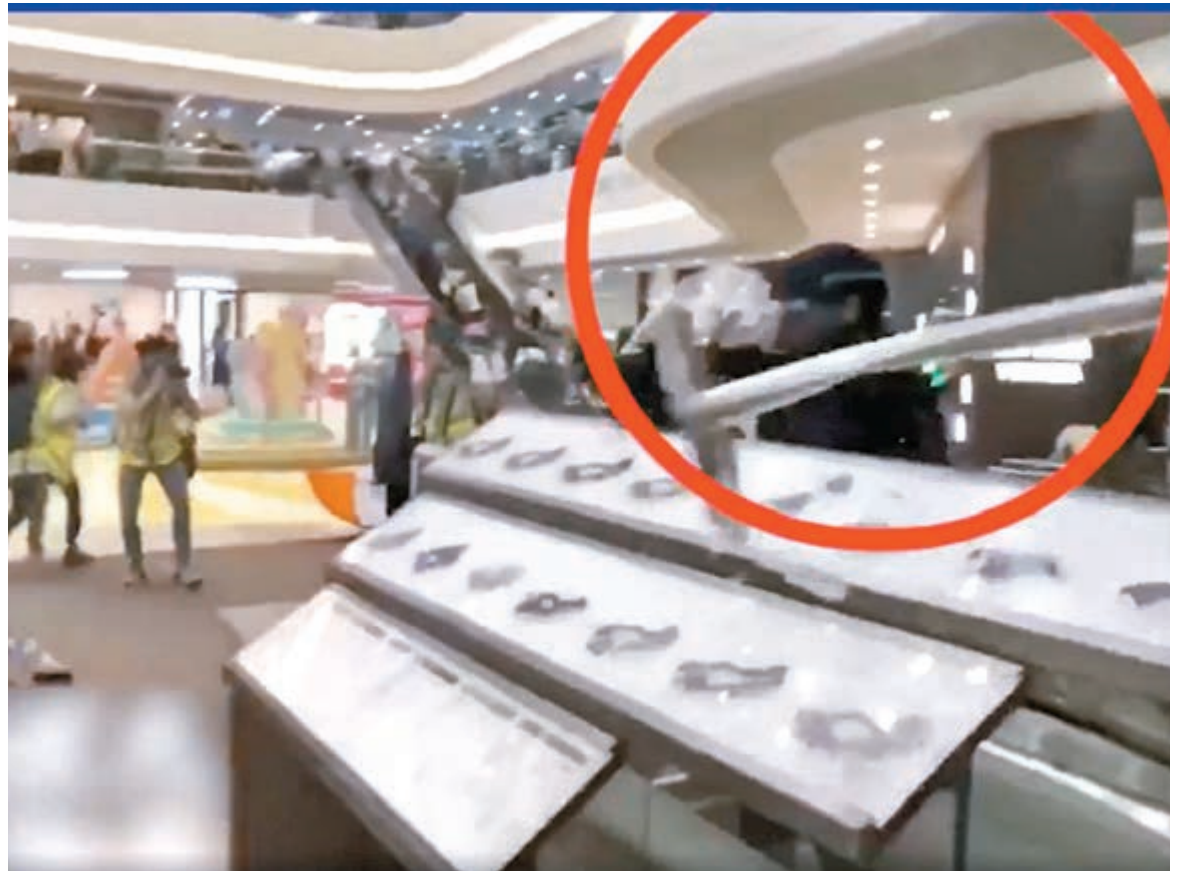
◆一名廣告女編輯2020年7月1日在時代廣場將一支拉帶鋼柱從3樓擲下，險擊中警員。

陳官最終認為本案須判處阻嚇性刑罰，遂就被告有意圖而企圖導致身體受嚴重傷害罪判囚兩年半、高空擲物罪判囚三星期、盜竊罪判囚一個月，其中首兩項控罪刑期同期執行，盜竊罪則分期執行，總刑期為31個月，即兩年7個月。雖然控方指其肆Lady M打算不追究涉案鋼柱的損失，但陳官仍頒下賠償令，下令被告三個月內支付1,000港元。