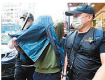
◆一名男董事被捕。