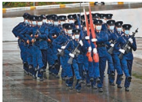
◆香港警隊表演中式步操。 資料圖片

香港文匯報訊 香港特區政府警務處13日宣布，香港警隊已決定由今年7月1日起全面轉用中式步操。除各典禮儀式及結業會操外，各級人員日常也須遵守敬禮等中式步操禮儀。