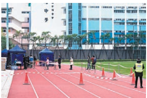
◆屯門兆麟運動場流動採樣站，昨日人流明顯減少。