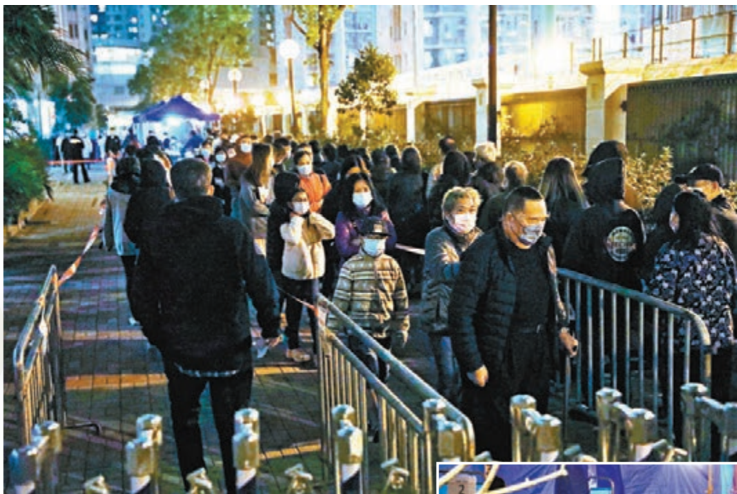
▲特區政府昨晚7時圍封將軍澳唐俊街11號寶盈花園第四座，作強制檢測。居民前往檢測大排長龍。

他表示，本月6日至13日期間，竹篙灣有2,150人完成檢疫，當中600人要緊急檢測，結果仍有60人延遲一兩天才能離開，他代表竹篙灣團隊向受影響市民致歉，會加強系統的督導，確保多個環節也不會遺漏檢疫人士資料。同時，竹篙灣由跨部門人員負責，包括有民安隊、醫療輔助隊、機電署、警隊及消防等，人手已由600人增至1,000人，以改善工作。