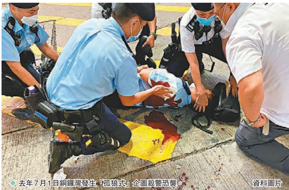
◆去年7月1日銅鑼灣發生「孤狼式」企圖殺警恐襲。資料圖片

去年7月1日，銅鑼灣發生「孤狼式」企圖謀殺警員的本土恐怖襲擊後，攬炒派一直將畏罪自殺身亡的兇手美化為「烈士」，更散播仇警及鼓吹暴力。警方在網上追捕煽暴者，6天內拘捕4名「連登仔」，他們涉嫌在網上散播用刀刺殺警員的「攻略」。警方經進一步調查及徵詢律政司意見後，於昨日起訴其中兩男一女。其中，20歲女學生被控以一項煽惑他人犯意圖傷人，34歲男子及36歲男子則被控以各一項煽惑他人意圖造成身體嚴重傷害，案件將於1月21日於東區裁判法院提堂。