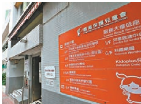
◆社署將派遣專隊進駐「童樂居」，每天駐守幼兒中心，實地密切監察中心的日常運作。資料圖片

「童樂居」爆出大規模虐兒醜聞，警方西九龍總區重案組21人專責小組，日以繼夜檢視近6萬小時閉路電視影片，涉及50多個閉路電視鏡頭由去年9月至12月底拍攝的院舍室內外情況，目前已檢視當中約兩成片段，並自上月22日至前日揭發至少有29名幼童受虐，先後拘捕並起訴16名女