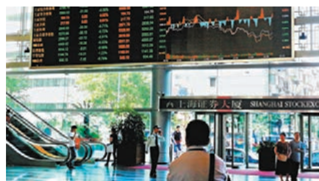
◆滬指昨收報3,521.26點,跌34點。