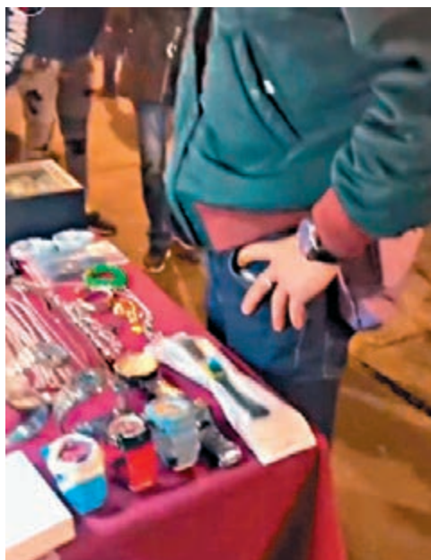
◆片段所見，攤檔上物品為涉案證物。視頻截圖