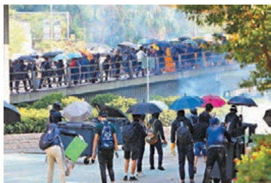
◆大批黑暴分子於佐敦一帶堵路。資料圖片