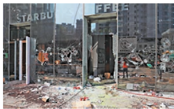
◆佐敦部分店舖被大肆破壞。資料圖片