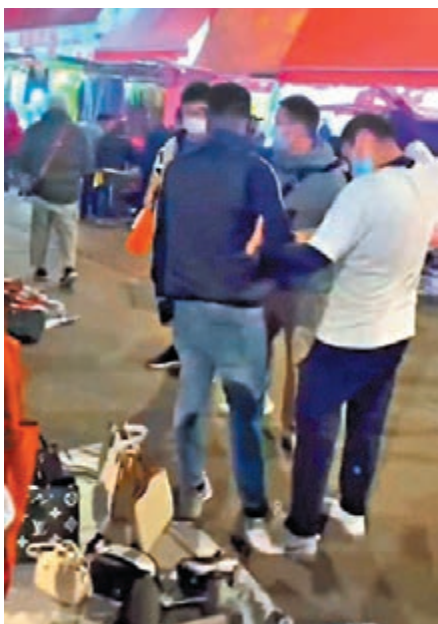
◆被捕南亞裔男子（黑帽）一度辯稱「唔係我嘍，係我朋友……」。視頻截圖

沒有拍攝到上述的對話，片中只見數名關員在列貨攤前控制住一名南亞裔男子，其間有人行到證物範圍拍攝，被關員要求「行開，不要影」，片中南亞裔男子則口口聲聲稱「唔係我嘍，係我朋友……」，明顯與帖文所寫不同。