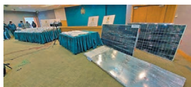
◆海關展示另一宗檢獲的太陽能板及毒品。