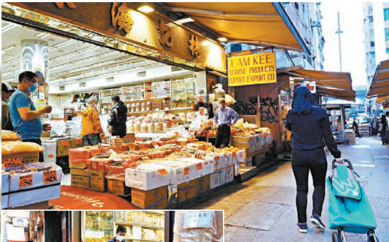
▲海味街一帶採購顧客不多，大部分內街店舖生意冷清。