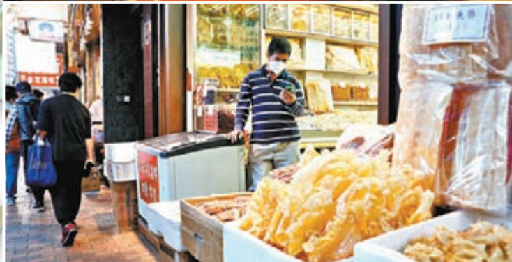
▲店舖生意冷清，職員睇手機打發時間。