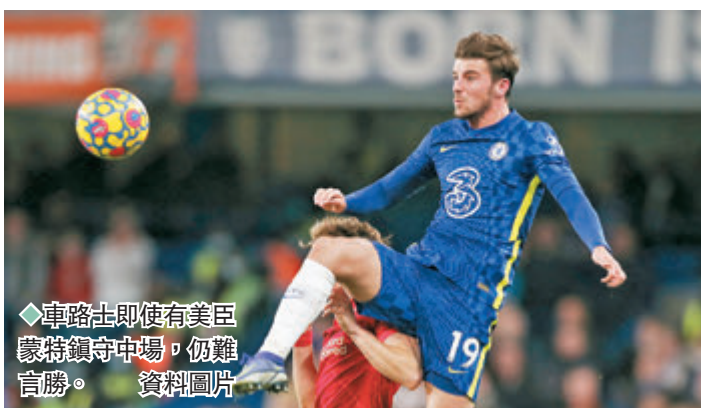
◆車路士即使有美臣蒙特鎮守中場，仍難言勝。資料圖片

剛於本土盃賽雙殺熱刺的車路士，上仗被表現更勝一籌的榜首勁旅曼城以 1:0 擊敗，聯賽連續 3 輪失分，當中場場有波失合計 4 度被攻破大門。今季貢獻不少入球和助攻的「帶刀侍衛」列斯占士長期養傷影響尤大，守將芝維爾、查洛巴亦續列「十字軍」，而門將艾度亞文迪正出戰非洲國家盃，「車仔」人腳並不完全。