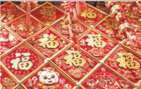
◆新年伊始，迎春接福！

來不聽，而是我們要有一個客觀和開放的態度，在創業中確實會遇到很多困難和挫折，所謂萬事起頭難，也一定會犯一些大大小小的錯誤，可是如果我們能夠這麼想，正是因為別人提出我們的不足之處，這樣才能夠重新調整自己的定位，規劃創業的發展方向，彌補不足之處，進而取得更好的成績。有一句話說得好：別人投訴你，就是在投資你。如果我們能夠這麼想，在負能量中吸取一些有用的東西，摒棄一些有害的東西，用一份為二的目光看待問題，我們才不會誤入情緒的漩渦裏。 在創業中需要這種精神，在生活中也更需要這種胸懷和態度，世界是什麼樣子的，在於你眼中所看到的是什麼樣子。一件東西斜了歪了，如果你一直在看還是覺得不對勁，去解決了也解決不好，這個時候不妨調整一下目光。對待負能量，也是這樣的。