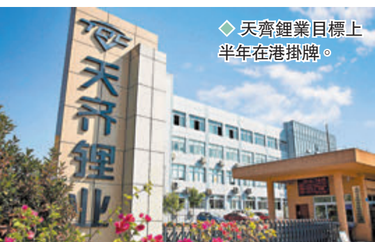
◆天齊鋁業目標上半年在港掛牌。

經營本地原創品牌小黃鴨「B. Duck」的母企德盈控股(2250)昨首掛造好，開報2.6元，早段一度高見2.77元，較招股價2.05元高約35%，收報2.39元升16.6%，每手賬面賺340元。