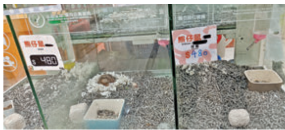
◆旺角「金魚街」有寵物店在倉鼠缸貼上「停售」告示。香港文匯報記者攝