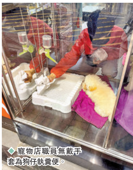
◆寵物店職員無戴手套為狗仔執糞便。