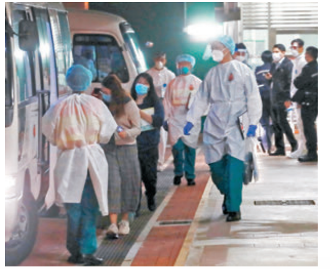
▲美孚新邨3期百老匯街74號昨晚被圍封強檢，部分住客需要乘專車撤離。