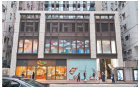
▲學之園幼稚園位於香港英皇道856號，一名老師初確，源頭不明。