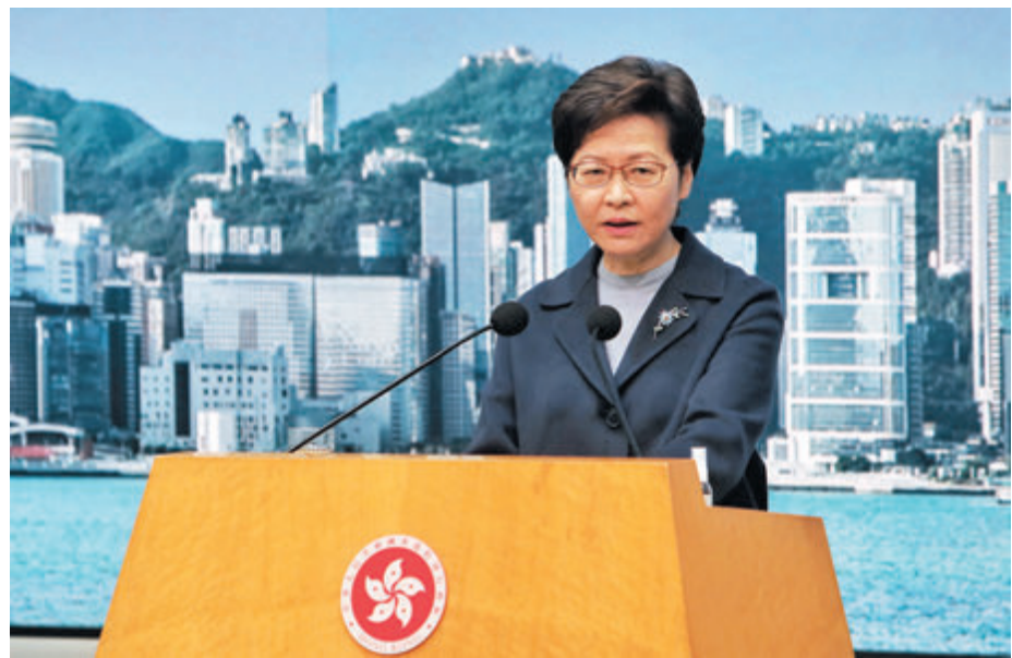
◆林鄭月娥表示，「防疫抗疫基金」的27項支援措施中，16項已經接受申請，將爭取部分援助金在農曆新年前發放。

教育局昨日亦發函通知學校相關津貼及資助，涉及總開支約3.38億元，減輕全港幼稚園、私立中小學日校及補習學校的財政困難，每所幼稚園及私立日校，會獲發放3萬元至8萬元不等的一筆過津貼，預計約1,000所幼