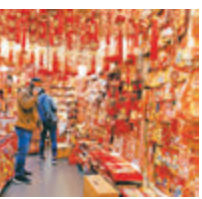
圖片攝於近日香港仔一間店舖。

再說回內地和香港的防疫策略。對於內地城市的管理者而言，疫情發生時，需要明暗兩條線同時作戰。明面上，是防疫措施決策制定上的快、狠、準，和執行上的周密、高效、有效；暗線上，則是對涉及疫情輿情的精準回應和及時平復。明面上的決策難度不大，執行上則因為疲勞作戰容易出現紕漏，但是在問責追責機制壓力下，基本上也能逐漸堵塞漏洞。真正的考驗是在暗線上。涉疫的輿論一旦應對不及時，處理不恰當，態度不溫暖，社交媒體上蜂擁而至的批判熱度，很大可能會讓地方的防疫付出和成效，在厚厚的濾鏡之下，呈現出極度不真的妖嬈姿態。這也對更精準更系統化的城市服