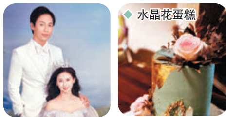
◆ 翁虹感謝老公讓她成為一個更好更優秀的自己！

香港文匯報訊（記者 凡文）現年34歲的韓國女團T-ara前成員朴素妍宣布結婚，對象是小她9歲的足球運動員趙佑民，素妍所屬的Think娛樂也證實了婚訊：「朴素妍與趙佑民經過3年的熱戀，預計在今年11月結婚。」據知，二人2019年透過友人的介紹而認識，穩定交往3年，近期萌生想結婚的