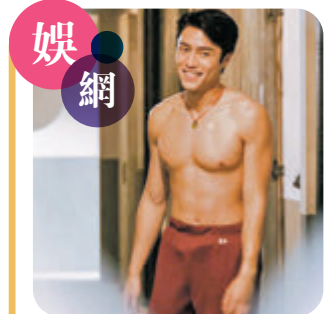
◆ 丁丁笑稱只是一場誤會。