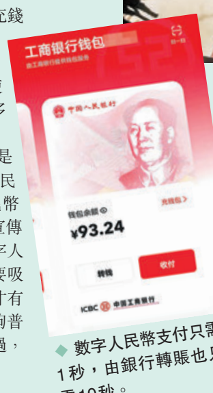
◆數字人民幣支付只需1秒，由銀行轉賬也只需10秒。

冬奧會的來臨，成為數字人民幣在海內外廣泛使用一大契機。深圳作為全國首批數字人民幣試點的重要城市，近兩年來數字人民幣生態體系建設日趨完善。香港文匯報記者昨在深圳各大商場、連鎖藥店和小商店等，均可以一秒鐘方便快捷地支付。記者從深圳金融部門了解到，截至2021年末，深圳數字人民幣受理商戶已超30萬家，基本覆蓋了生活服務、零售消費、餐飲服務、交通出行、教育醫療、智慧民生、政務服務等各領域。 ◆文/圖：香港文匯報記者 李昌鴻 深圳報道